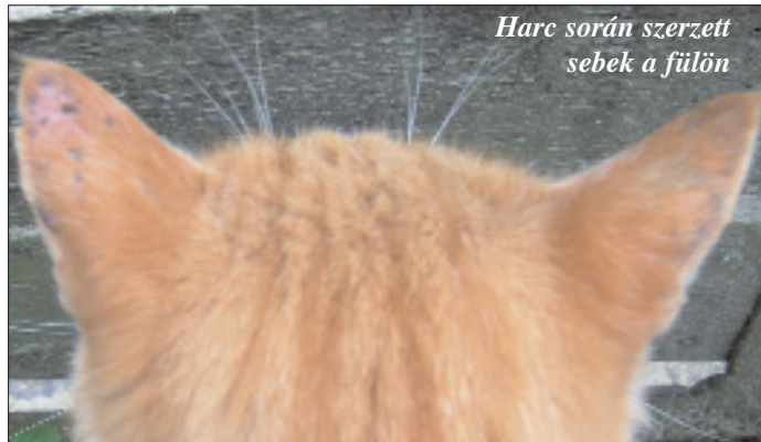
Harc során szerzett sebek a fülön

Ilyen tünetek esetén azonnal adjunk naponta 4–5-ször